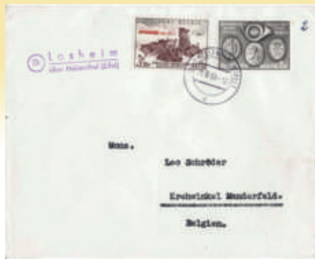
Foto 6 Brief met Belgische zegels, afgestempeld met Duits stempel na de overdracht aan Duitsland. De afstempeling is van het kantoor van Hellenthal (Eifel), met een naamstempel van Losheim. Het stempel is gedateerd op 28/08/1958 om 12 uur, het exacte uur van de overdracht door België. Het betreft dus de eerste lichte door de Duitse post.

Vanaf dat ogenblik hield Bollenië op te bestaan. De gebeurtenissen rond deze gebieden verdwenen in het niets bij al het nieuws rond de wereldtentoonstelling van 1958, maar 50 jaar later is het misschien interessant even aan deze voetnoot in onze nationale geschiedenis te denken.