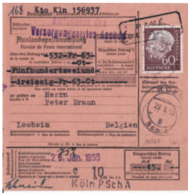
Foto 4 - Voorzijde van een internationale postwissel vanuit Duitsland naar Losheim (29/1/1955)

De grens werd gecorrigeerd bij het Verdrag tot correctie van de Belgisch-Duitse grens van 24 september 1956. Dit verdrag hield de teruggave in van een aantal gebieden aan